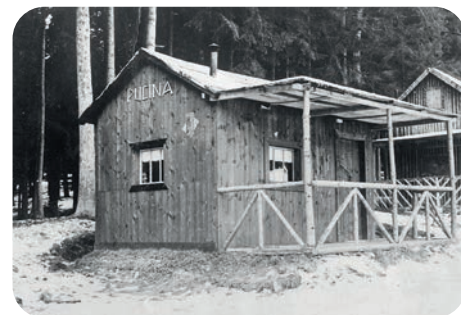
Původní chaty byly vystavěny velmi jednoduše.