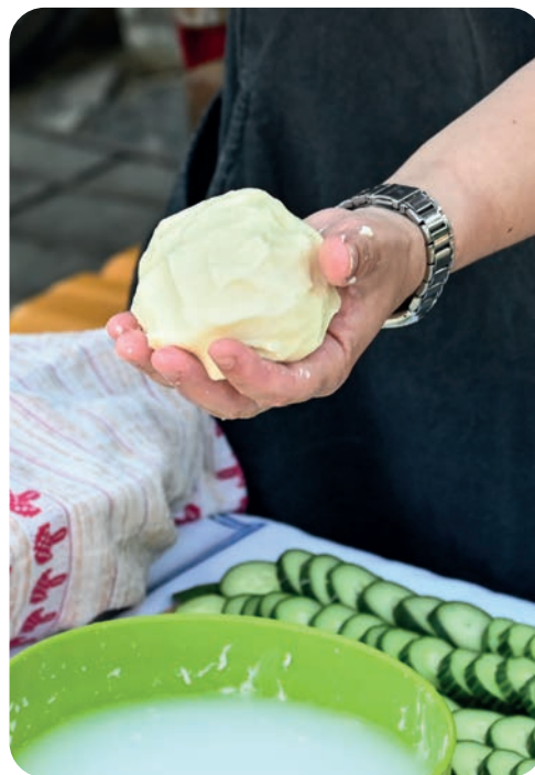
Máslo se dříve stloukalo v dřevěné máselnici, dnes nám stačí i malý ruční šlehač.

Chov zvířat, který dbá na jejich přirozené potřeby, můžeme podpořit nákupem jejich produktů. Týká se to mléčných a masných výrobků nebo vajec. Dnes se čím dál více lidí zajímá o to, v jakých podmínkách byla chována zvířata, jejichž produkty konzumují. Roste zájem o biopotraviny, lokální produkty z malých farem i komunitou podporované zemědělství, a to i přesto, že jsou tyto výrobky zpravidla dražší než ty ze supermarketů. Proč je cena u těchto výrobků vyšší?