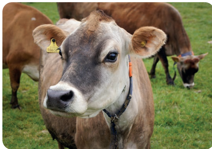
Na farmě chovají krávy plemene jersey.

Zjistěte, které druhy zvířat tu chovají. Znáte i jejich plemena?