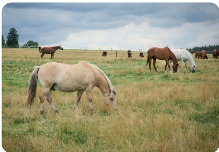
Koně se na pláních pod tehovskou radiostanicí pasou celoročně.

Farma v Tehově vznikla v roce 1999 na místě bývalého kravína, který dříve patřil pod JZD Mír Světice. Hlavním posláním farmy je plemenářská práce. Farma se dále soustředí na ustájení koní a chov ovcí. Zvířata tu chovají s důrazem na jejich přirozené potřeby. Na farmě funguje i malá mlékárna, kterou zásobuje mlékem jen 8 krav. Vedle ní je také samoobslužné občerstvení. Veškeré objemné krmivo si na farmě vyrábějí sami na 100 hektarech luk a pastvin, které farma obhospodařuje. Farma pořádá pravidelné dny otevřených dveří, akce pro děti a funguje zde i chovatelský kroužek.