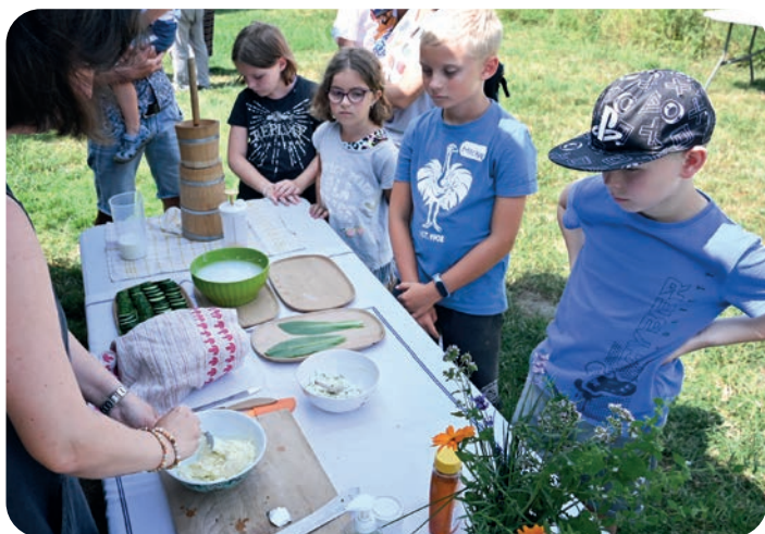
Ukázka výroby másla na akci Muzea Říčany.

Kupte si v místní prodejně smetanu ke šlehání a vyrobte si z ní v ručním šlehači domácí máslo. Můžete si jej dochutit solí, bylinkami, česnekem nebo třeba medem. Nebo vymyslíte svou vlastní příchut? Jak vám vlastnoručně vyrobené máslo chutnalo?