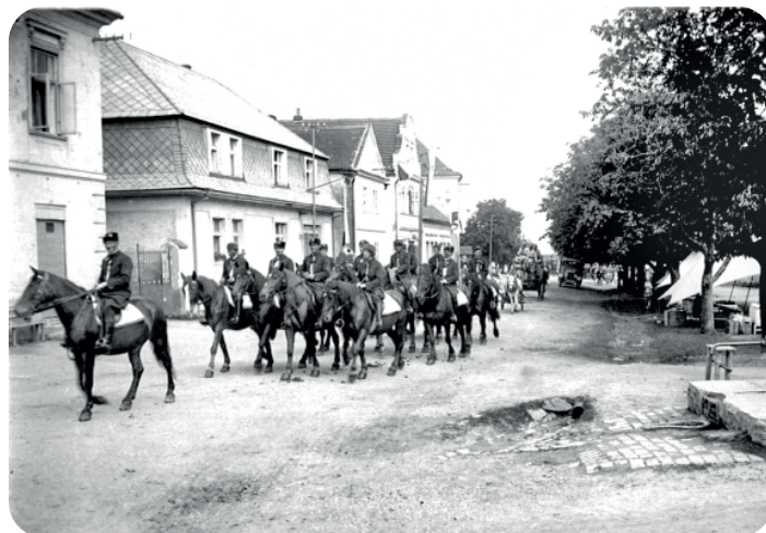
Mladíci z rodin ondřejovských sedláků se účastnili každoroční selské jízdy.

Že už ulicemi Ondřejova žádné průvody kluků na koních nejezdí? Tento místní pamětník dává ukončení ondřejovských selských jízd do souvislosti s tzv. Nechanickou aférou. V roce 1947 v obci Nechanice zakázalo ministerstvo vnitra konání velkých závodů selské jízdy. Důvodem bylo propojení selských jízd s agrární stranou, kterou venkov silně podporoval. Komunisty ovládané bezpečnostní sbory bránily v konání závodu 300 jezdců a 5 000 návštěvníků. Tato aféra předcházela komunistickému puči v únoru 1948. Více o této události zjistíte v Čítance kolektivizace .