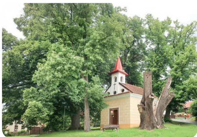
Torzo lípy u kaple ve Zvánovicích

Obrys koruny nebo stínu dávno zmizelé lípy zkuste na podzim vyskládat ze spadaneho listů. Nebo tvar vytvořte z vašich vlastních těl.