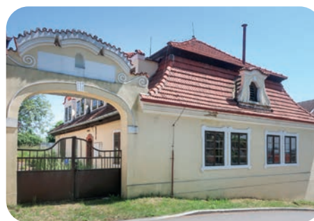
Barokní statek, později kempelička. Od roku 1957 se tu vyráběly slavné remosky, malé přenosné troubky.

☑ Zamyslete se, k čemu by mohl střed obce sloužit v současnosti a jak ho upravit, aby tu bylo lidem příjemně. Připravte projekt s nákresem a myslete na různé skupiny obyvatel (místní i návštěvníky), ptáky, hmyz a dešťovou vodu. Inspirujte se animací Ulice budoucnosti .