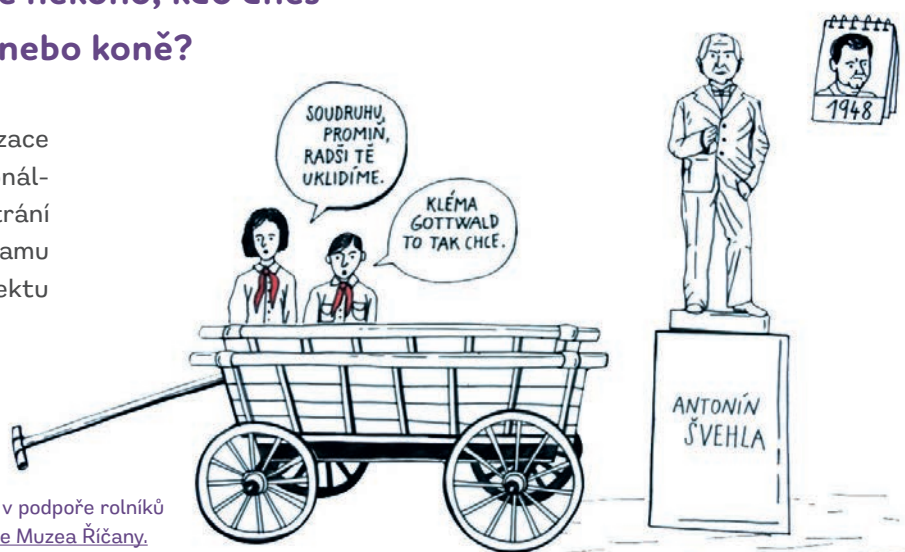
O Antonínu Švehlovi a jeho roli v podpoře rolníků zjistíte více ve videu na YouTube Muzea Říčany .

O osudech sedláků za komunistické kolektivizace se dozvíte z audionahrávek na webu Regionální učebnice Říčansko. Pusťte se sami do pátrání nebo natáčení reportáží podle návodů v programu Proměny krajiny nebo se zapojte do projektu Příběhy našich sousedů .