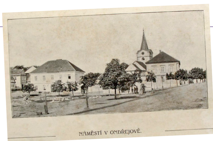
Na staré pohlednici vidíme ondřejovské náměstí s rybníčkem.

Jakou změnu byste na náměstí uvítali? Kam v Ondřejově rádi chodíte?