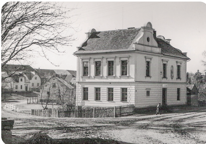
Škola v roce 1900. Vlevo je vidět budova kempelčiky (družstevní záložny) s muzeem, dnes na tomto místě najdete obecní úřad.

Škola zahájila výuku 1. září 1900 se 66 žáky. Víte, kolik žáků má škola dnes? Ze školní kroniky víme nejen, kdy škola vznikla a kolik tu studovalo žáků, ale popisuje také, kam děti chodily na výlety, kolik nasbíraly sušených bylin a kde v Kunicích strašilo. Znáte nějaké zajímavé místo v Kunicích, o kterém se vypráví příběhy? Zkuste se zeptat pamětníků.