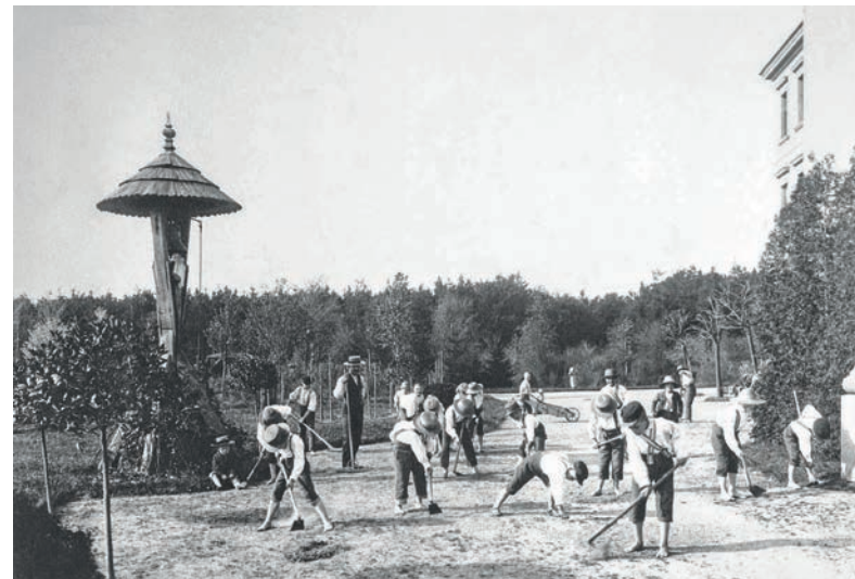
Zvonice je na stejném místě dodnes