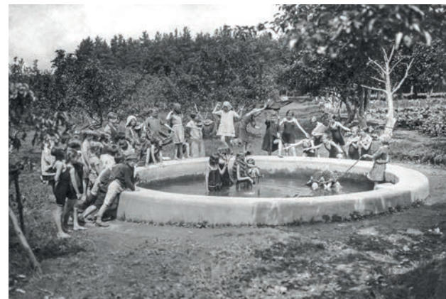
Brouzdaliště v ústavní zahradě zapojené do divadelního představení

Zařízení prošlo v dalších letech mnoha změnami. Od roku 1926 tu byla ozdravovna, během druhé světové války se zaměřila na léčbu tuberkulózy. Po únoru 1948 se z Olivovny stala Dětská zotavovna Mír. Roku 1980 zde byla vytvořena odborná léčebna pro děti s opakovanými a dlouhodobými onemocněními dýchacích cest. Do roku 1995 fungovala jako státní zařízení, poté jako nestátní nadační organizace a nyní je obecně prospěšnou společností. V současné době se v Olivově dětské léčebně léčí onemocnění dýchacích cest, pohybového ústrojí a obezity.