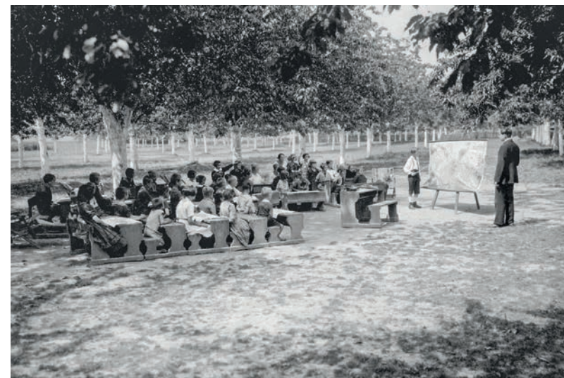
Děti se učily i venku

Zařízení prošlo v dalších letech mnoha změnami. Od roku 1926 tu byla ozdravovna, během druhé světové války se zaměřila na léčbu tuberkulózy. Po únoru 1948 se z Olivovny stala Dětská zotavovna Mír. Roku 1980 zde byla vytvořena odborná léčebna pro děti s opakovanými a dlouhodobými onemocněními dýchacích cest. Do roku 1995 fungovala jako státní zařízení, poté jako nestátní nadační organizace a nyní je obecně prospěšnou společností. V současné době se v Olivově dětské léčebně léčí onemocnění dýchacích cest, pohybového ústrojí a obezity.