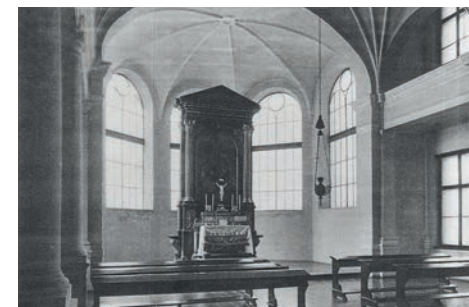
Nahoře kaple Olivovny, dole krejčovská dílna

(Gustav Trnka v knize Město Říčany v minulosti i přítomnosti o počátcích Olivovny)