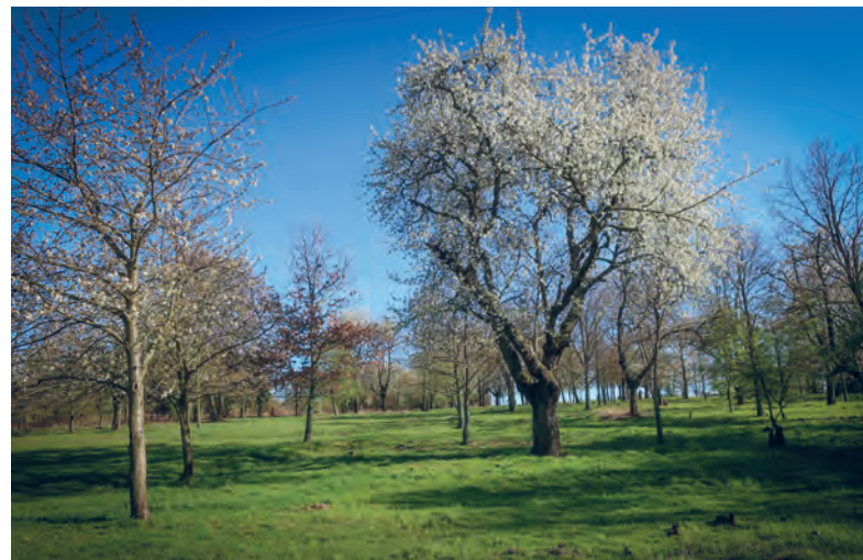
Dnešní třešňovka cestou z města ke skautské klubovně