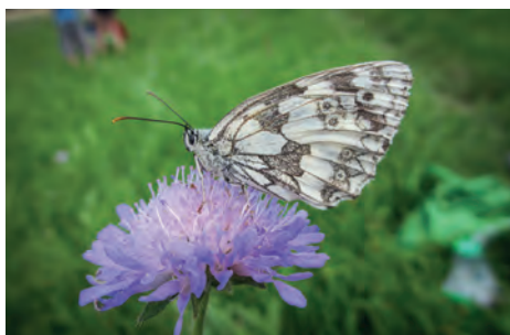
Okáč bojínkový na chrastavci

Louce dominuje starý dub s několika kmeny. Je to místo, kde se lidé setkávají, nebo kde hledají samotu a klid. V jeho koruně často odpočívají ptáci a motýli, ale vejde se sem i velká skupina uličníků.