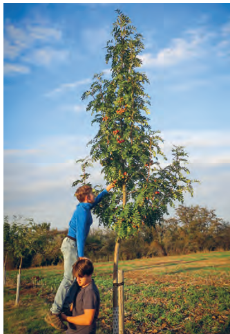
Dnešní uličníci ochutnávají oskeruše

„Cestou ze školy jsem chodila Olšanama a pak podél té stodoly, co je teď zbouraná. Když jsem šla v zimě ráno do školy, tak mi máma musela proházet cestu až skoro tam, jak je ta hala, ta ledová. Protože já bych se kvůli sněhu nedostala do školy.“