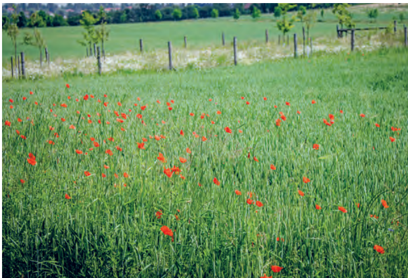
Remízy v krajině nad Marvánkem

Město Říčany bude muset v budoucnu řešit jak o ovocné stromy i kvetoucí plochy pečovat a jak do péče zapojit zemědělce nebo místní spolky a dobrovolníky. Při péči o kvetoucí a bzučící louky je ale vhodné používat stroje, které nezahlubí veškerý hmyz, k nejvíc postiženým patří kobylky nebo housenky motýlů. Lištvové sekačky se podle výzkumů jeví jako méně destruktivní než bubnové, samozřejmě nejméně hmyzu se usmrtí při ručním sečení kosou.