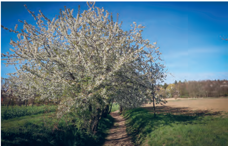
Stará úvozová cesta, dnes Alej Říčaňáků