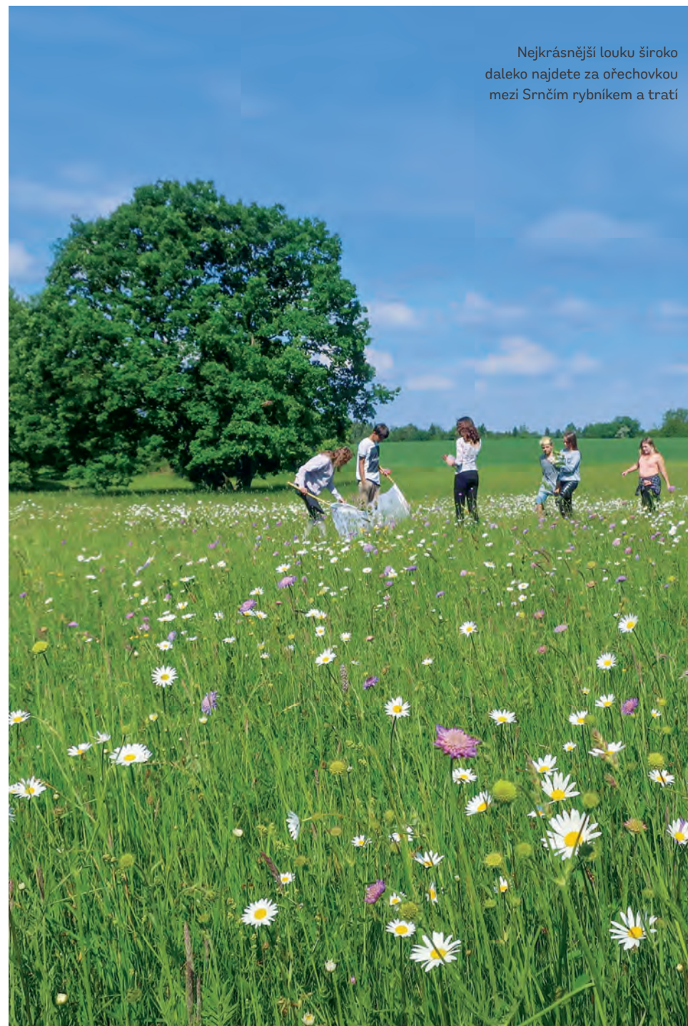
Nejkrásnější louku široko daleko najdete za ořechovkou mezi Srnčím rybníkem a tratí