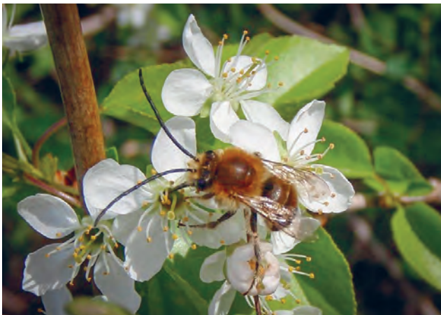
Samotářská včela stepnice dlouhorohá