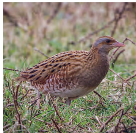
Chřástal polní patří mezi ubývající druhy Evropy a jeho život je velmi málo známý. Žije skrytě na loukách a v polích, odkud ani po vyrušení obvykle nevzlétne