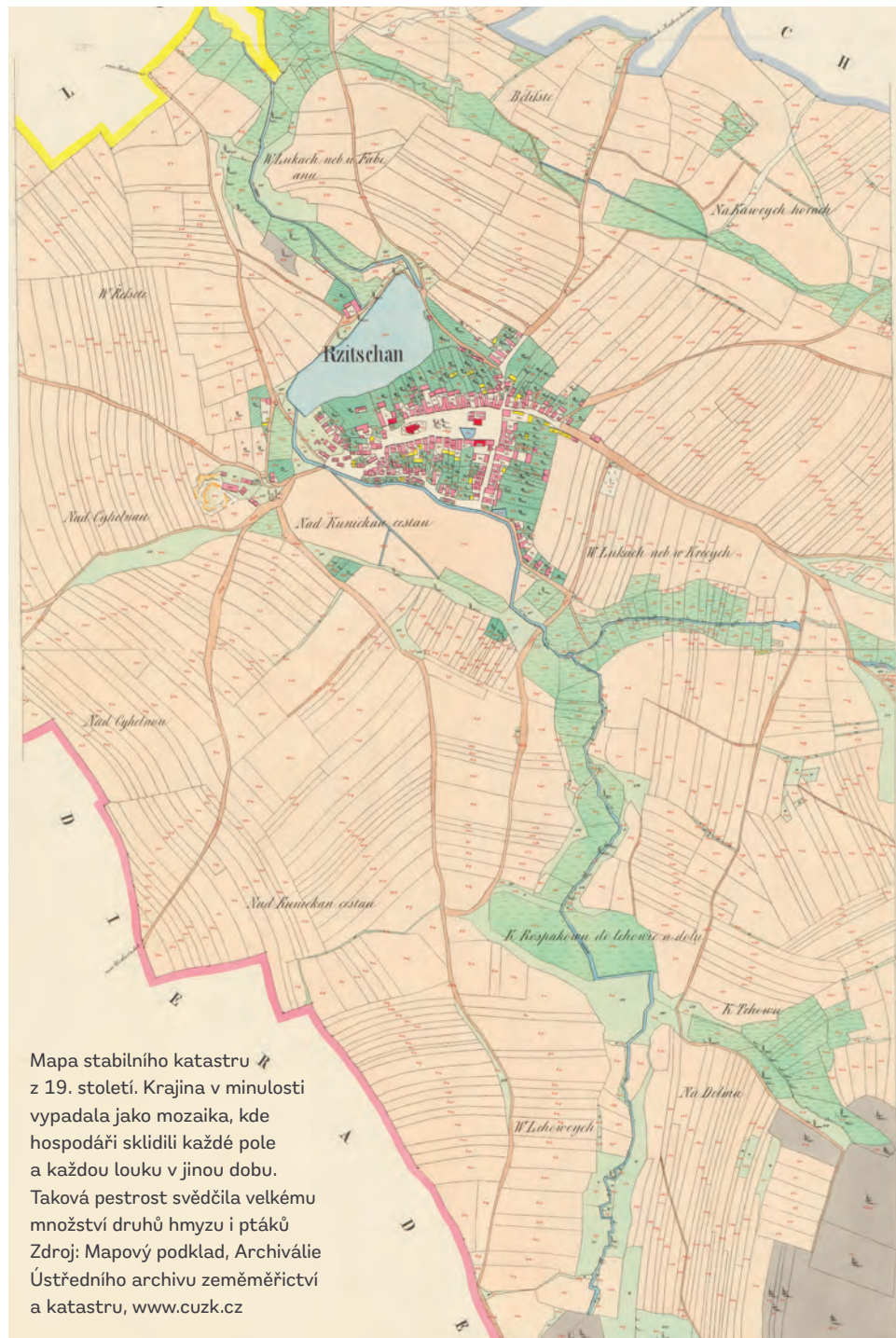
Mapa stabilního katastru z 19. století. Krajina v minulosti vypadala jako mozaika, kde hospodáři sklídili každé pole a každou louku v jinou dobu. Taková pestrost svědčila velkému množství druhů hmyzu i ptáků

Jiná úvozová cesta od skautské klubovny je teď už pohřbená pod asfaltem nové cyklostezky. V původním směru vede také polní cesta v ulici U Kamene, která byla říčanským nedělním korzem. Podle vzpomínek pamětníků se tu procházely a směřovaly do lesa dvojice, maminky s kočárky, celé rodiny. S nástupem komunismu byla většina polních cest rozorána.