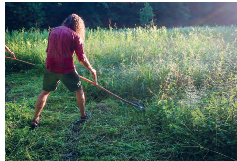
Letní ráno o senoseči

Zkoušeli jste někdy sekat srpem nebo kosou? Umíte kosu naklepat a nabrousit? Přes Ekocentrum Říčany můžete kontaktovat říčanské sekáče a získat tyto dovednosti od zkušenějších.