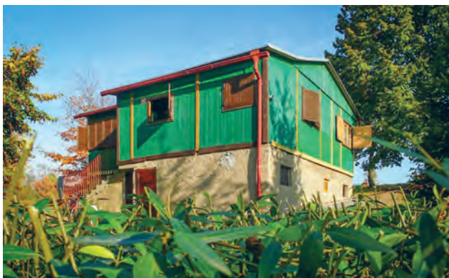
Původní skautská klubovna nedaleko Marvánku

„1. 11. 1969 je pro říčanské skauty významné datum. Slavnostně jsme otevřeli novou klubovnu, postavenou vlastními silami za podpory tehdejšího vedení města. Byl to pro nás zážrak. Získali jsme ‚domov‘. (...). Nezměrné nasazení všech a motorem jistě byl i závod s časem, protože po okupaci sovětským vojskem 21. 8. 68 byla budoucnost Junáka opět ohrožena. Krozba se také velmi rychle vyplnila. Skautský domov byl náš ani ne celý rok – v září 1970 byl Skaut opět komunistickou mocí zakázán.“