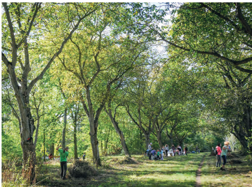
Posečené kopřivy a brhlíci dobrovolníci shrabou a hromadu odvezou ke zkompostování

Kromě třešní a jablek se v krajině zachovaly i ořešákové aleje. O jednu takovou ořechovku pečuje Ekocentrum Říčany a pořádá tu na podzim sousedskou ořechovou slavnost. Staré ořešáky mají různé dutiny, které k hnízdění využívají sýkory nebo brhlíci. Sídli tu i letní kolonie netopýrů, kteří loví komáry a jejich larvy z vodní hladiny přilehlého Srnčího rybníka a nádrže Rozpakov.