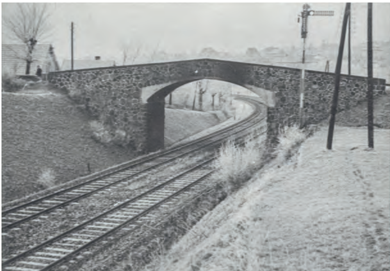
Most měnil svoji podobu. Tento snímek je z roku 1926