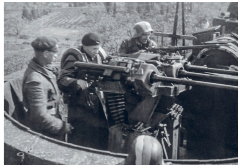
Povstalecká osádka flaku na ukořistěném německém vlaku v květnu 1945

Zastavte se u památníku se jmény padlých. Můžete k němu donést svíčku nebo kytičku. Zjistěte, co znamenají jména říčanských dobrovolníků v překladu: Schmerzenreich a Freiwillig.