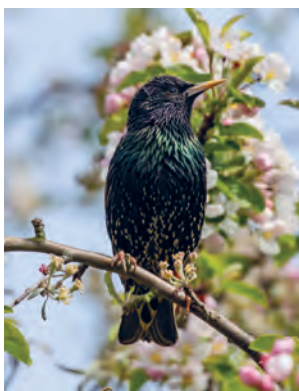
Špaček obecný

Vezměte si na vycházku dalekohled a pozorujte z mostu blížící se vlaky. Poznáte podle světel, jestli je trať volná? Dalekohledem se můžete dívat také na ptáky na stromech na náspech u trati. Na třešních si tu pochutnávají v létě špačkové, kosi a drozdi. Na jaře můžete zahlédnout hýly a sýkory, kteří ozobávají pupeny a hmyz na větvích.