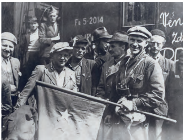
Povstalci na říčanském nádraží během květnového povstání