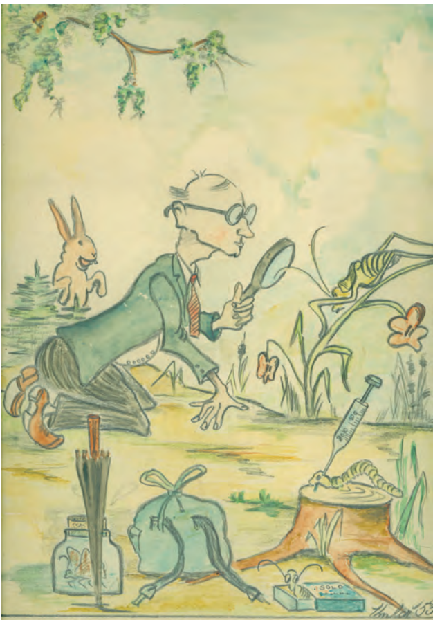
Karikatura sběratele brouků. Vyobrazen je patrně řídicí učitel Jan Tichý, který spolu s Janem Petříčkem sbíral hmyz pro muzejní sbírku. Shromáždili více než 3 000 exemplářů

„Táta sebral námě prostěradlo, vzaly se baterky a šli jsme na louku k lesu. Na dvě tyče se prostěradlo natáhlo a zezadu se svítilo baterkou. Na bílou plochu začaly lítat můry a brouci.“