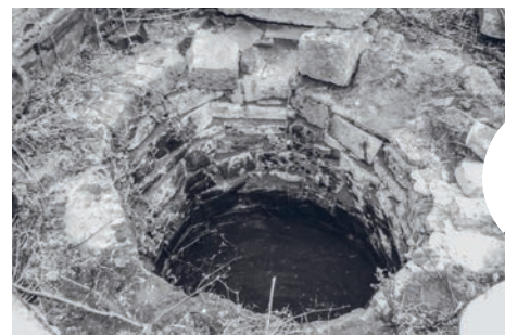
Studna ukrývající přes čtyřicet let tajemství zmizelé sochy