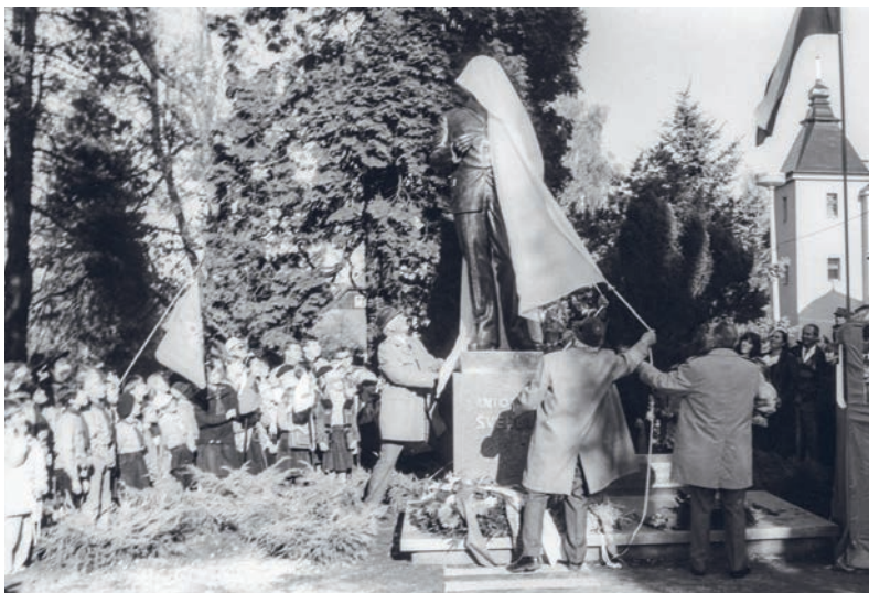
Slavnostní odhalení sochy 28. října 1990

Tereza Vostradovská (z animace Antonín Švehla a Říčany)