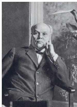
Antonín Švehla (1873–1933)

Byli to právě říčanští řepaři, kteří podnítli širokou veřejnost k tomu, aby Švehla zastupoval říčanský okres v rakouském parlamentu. Stalo se tak roku 1908. V následujícím roce postoupil do čela Republikánské strany zemědělského a malorolnického lidu (její členové se označovali jako agrárníci ). Švehla se v parlamentu snažil prosazovat práva Čechů, a především českých rolníků, což se mu většinou