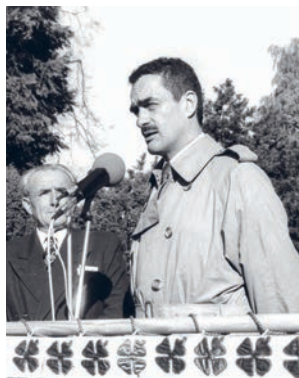
Na slavnosti promluvil i Karel Schwarzenberg, tehdejší kancléř prezidenta Václava Havla