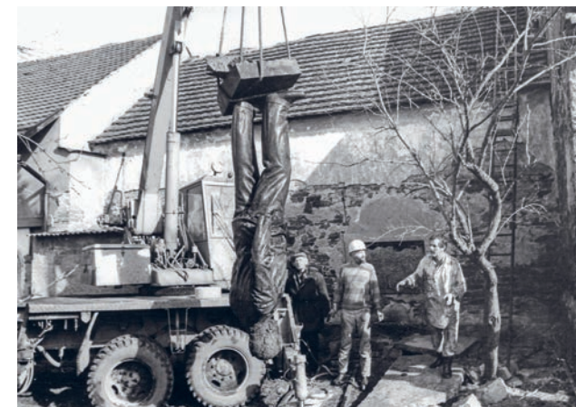
Vyzvednutí sochy ze studny v Lipanech po listopadových událostech 1989

Ty joo, udržet tak dlouho tajemství, to nevím, jestli bych vydržel!?