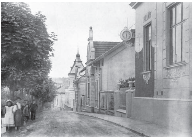
Cesta svobody, tehdy Sadová ulice, v roce 1912

Park Antonína Švehly je ve všedních dnech hlučné místo na dopravní křižovatce. Než narostla automobilová doprava ve městě, patřilo do klidné části v blízkosti původně secesních vil, které lemovaly cestu k nádraží.