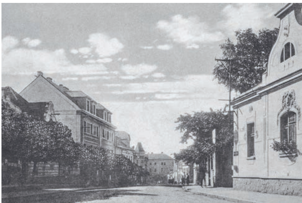
Cesta do centra města na konci dvacátých let 20. století

Kašna s vodotryskem se v parku objevila v sedmdesátých letech. Také dneska je vítaným zpestřením při procházce po Říčanech a dosud jediným vodním prvkem, který vás alespoň pocitově osvěží v rozpáleném letním městě. Nedaleko místa, kde dnes stojí Švehlova socha, bývala socha rudoarmějce. U ní se před listopadem 1989 konala shromáždění při příležitostech k připomenutí československo-sovětského přátelství. Místní lidé vojákovi říkali partyzán a když si u sochy dávali sraz, říkali, že se sejdou „u partyzána“. Sochu nyní najdeme na hřbitově a je součástí památníku rudoarmějců padlých při osvobození Říčan a tří vězňů z transportu smrti.