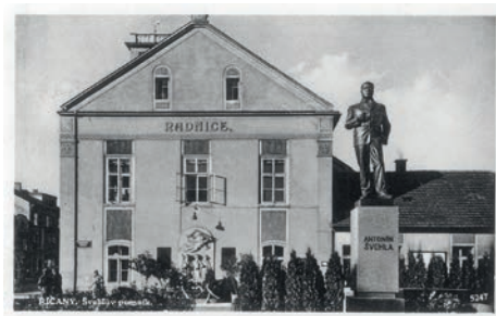
Původní umístění Švehlovy sochy před radnicí v Říčanech