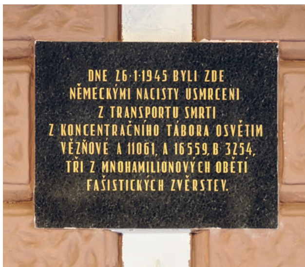
Pamětní deska na říčanském nádraží

Na začátku roku 1945 stál několik hodin na nádraží kvůli poruše vlak smrti. Tři vězni se pokusili shrábnout sníh, aby se napili – hlídkující esesáci je zastřelili a nechali ležet v blízkosti kolejí. Jsou pohřbeni na místním hřbitově. Jejich jména neznáme, jen čísla, která měli vytetovaná na předloktí.