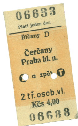
Jízdenka na kartičce z tvrdého kartonu, sedmdesátá léta 20. století

Zprovoznění železniční trati Praha-Benešov na dráze císaře Františka Josefa I. v roce 1871 bylo pro obyvatele Říčan a okolních obcí skutečnou revolucí. Hlavní město se tak přiblížilo pro dojíždění za studiem a za prací. Pražané se zase rychle dostali do venkovského prostředí a objevovali městečko s rybníky a lesy pro výlety i letní pobyt. Nejprve tu byla jen zastávka, v roce 1874 vzniklo malé přízemní nádraží. Větší patrová budova dokončená roku 1894 pak sloužila až do roku 2008.