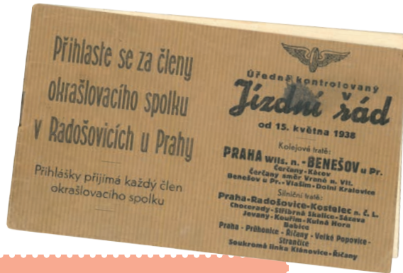
Jízdní řád z roku 1938

„Nádraží bývalo v době mého mládí upravené. Pořádek, který tam vládl, se moc nezměnil od dob císařství. Množství zaměstnanců pracovalo jak uvnitř, tak venku, například vymetali výhybky a čistili lampy. Ty byly všude ještě petrolejové. Na vše dohlázel přednosta stanice, který na nádraží i bydlel.“