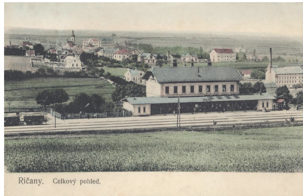
Říčany. Celkový pohled.