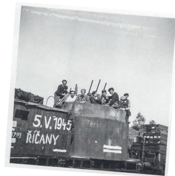
Flak, který obsadili povstalci