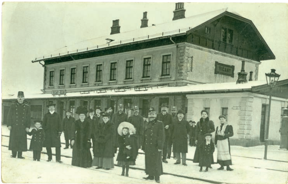
Drážní zaměstnanci seřazení na kolejích před budovou nádraží, začátek 20. století