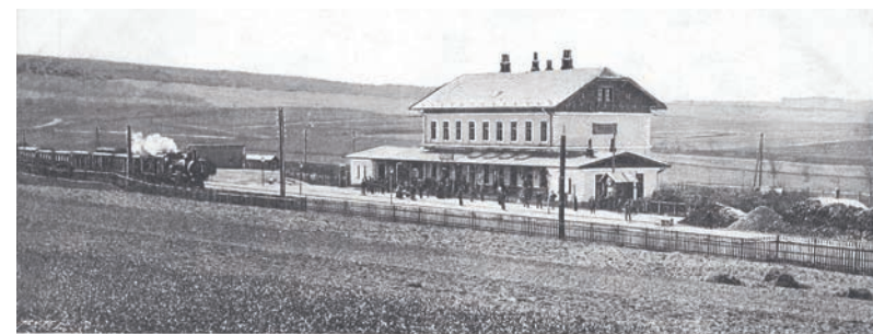
Pozdrav z Říčan.

(Gustav Trnka v knize Město Říčany v minulosti i přítomnosti o srpnovém dni roku 1898)