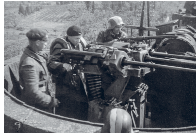
Povstalecká osádka flaku na ukořistěném německém vlaku v květnu 1945

Zastavte se u památníku se jmény padlých. Můžete k němu donést svíčku nebo kytičku. Zjistěte, co znamenají jména říčánských dobrovolníků v překladu: Schmerzenreich a Freiwillig.