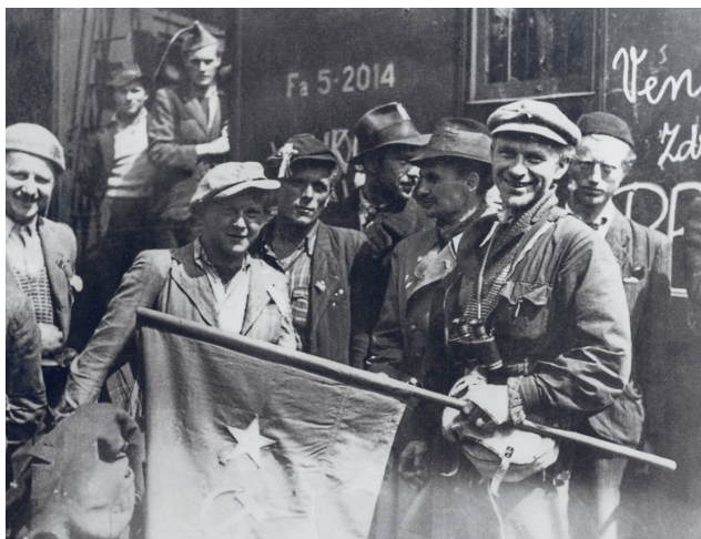
Povstalci na říčanském nádraží během květnového povstání