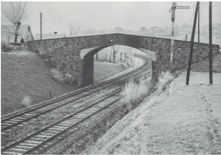
Most měnil svoji podobu. Tento snímek je z roku 1926