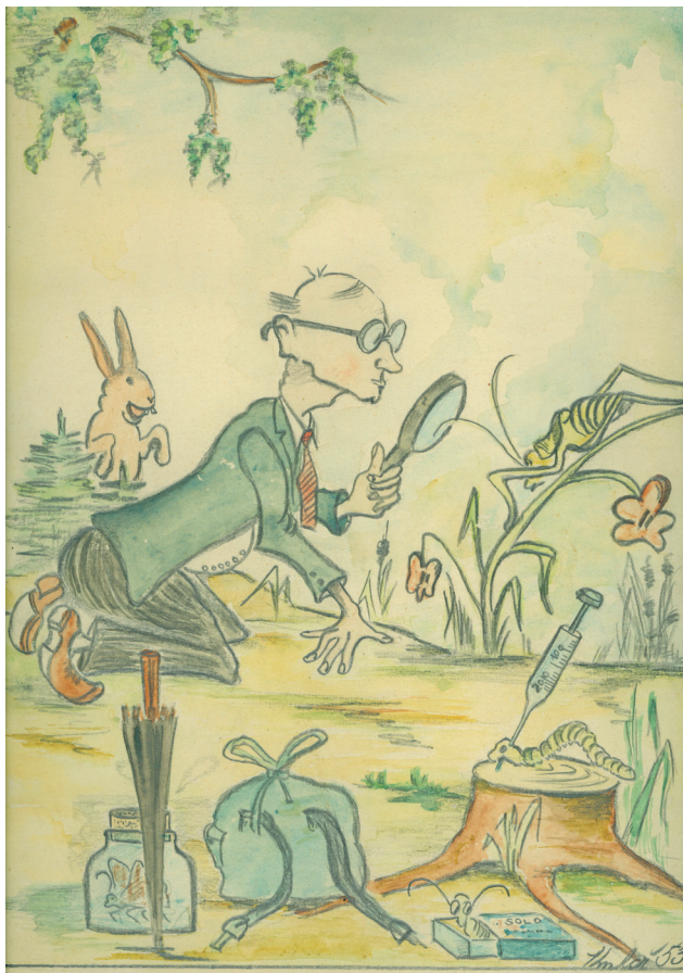
Karikatura sběratele brouků. Vyobrazen je patrně řídicí učitel Jan Tichý, který spolu s Janem Petříčkem sbíral hmyz pro muzejní sbírku. Shromáždili více než 3 000 exemplářů

„Játa sebral mámě prostěradlo, vzaly se baterky a šli jsme na louku k lesu. Na dvě tyče se prostěradlo natáhlo a zezadu se svítilo baterkou. Na bílou plochu začaly lítat můry a brouci.“