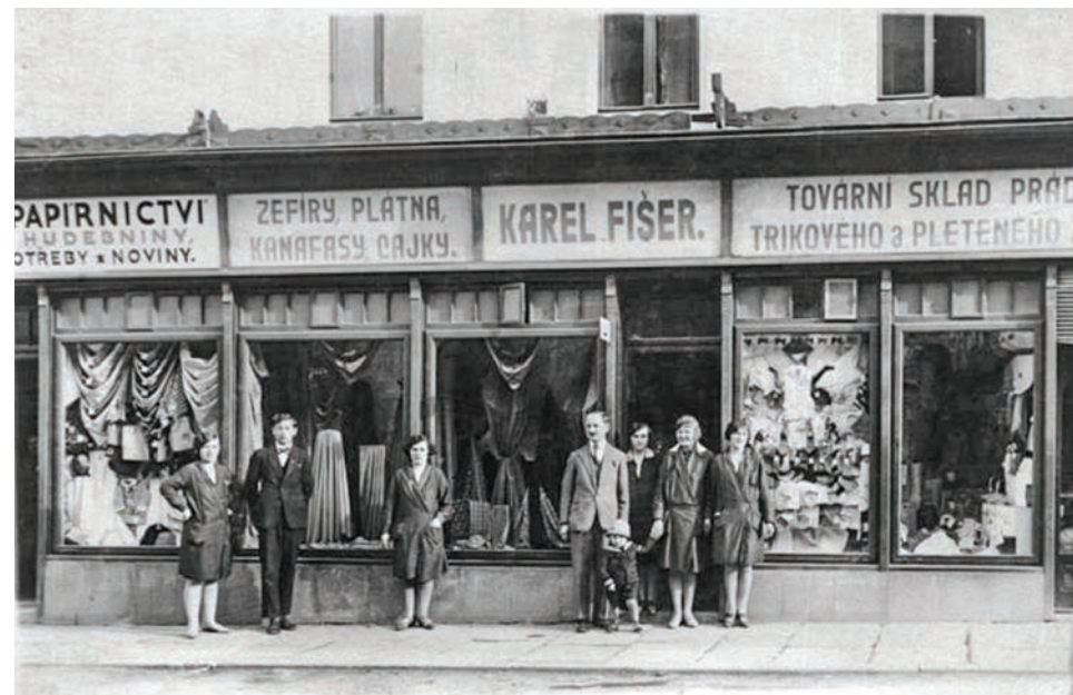
Prvorepublikový obchod rodiny Fišerovy kousek od kostela