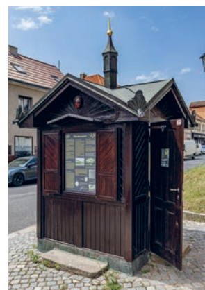
K připomenutí židovských obyvatel, kteří spoluvytvářeli říčanské dějiny, slouží na Masarykově náměstí infostánek ke „kamenům zmizelých“