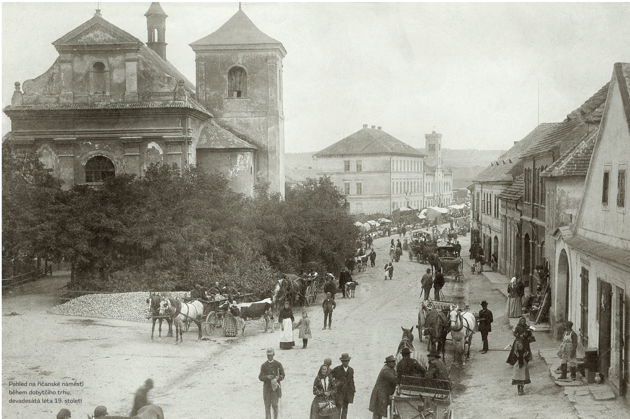
Pohled na říčanské náměstí během dobytčího trhu, devadesátá léta 19. století