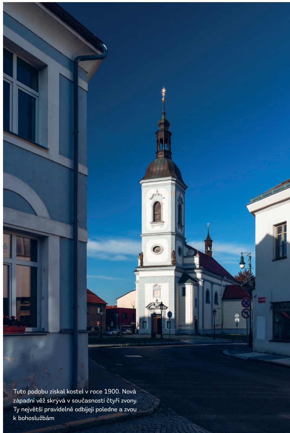
Tuto podobu získal kostel v roce 1900. Nová západní věž skrývá v současnosti čtyři zvony. Ty největší pravidelně odbíjejí poledne a zvou k bohoslužbám

Poznáte Petra od Pavla? Který z nich drží klíč od království nebeského?