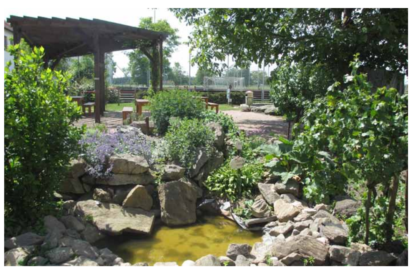
Exkurze na ukázkovou školní zahradu ZŠ Myslibořice

Tématu školních zahrad se už řadu let věnují některá střediska EVVO, seznam doporučených publikací najdete v kapitole Zdroje informací a inspirace.