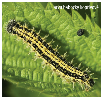
larva babočky kopřivové

Díky dlouhodobému mapování denních motýlů, které má u nás velkou tradici, poměrně dobře víme, jaké druhy motýlů se v daných regionech vyskytovaly dříve a jaké se tam vyskytují nyní. Bilance je to většinou neradostná, výrazný úbytek a ochuzování motýlí fauny je stále silnější jak na úrovni zastoupení druhů, tak i na úrovni početnosti v rámci jednotlivých druhů. Označit dnes určitý druh motýla jako „hojný“ či dokonce „běžný“ se stává téměř nadsázkou.