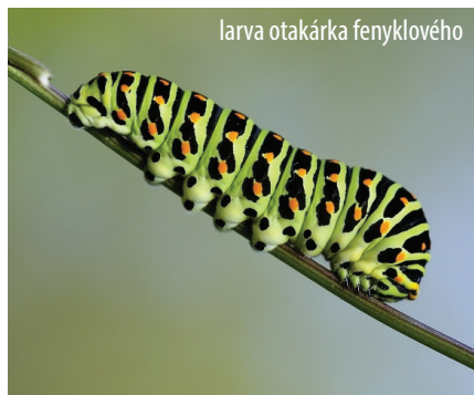
larva otakárka fenýklového